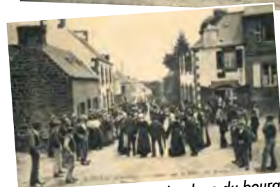
Noce et danse sur la place du bourg.

Une nouvelle brochure « Scrignac documents pour servir à l'histoire » réalisée par Michel Penven sortira en tirage limité : foires et marchés, débits de boissons fin XIX e /XX e , l'arrivée de l'eau, de l'électricité, la poste et les cabines téléphoniques, chemins, le recensement du bourg 1968 (habitants et commerces), le bombardement de 1944 et la reconstruction, nouvelle mairie, groupe scolaire... le tout illustré de documents inédits !